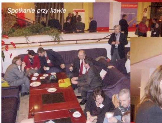
Spotkanie przy kawie