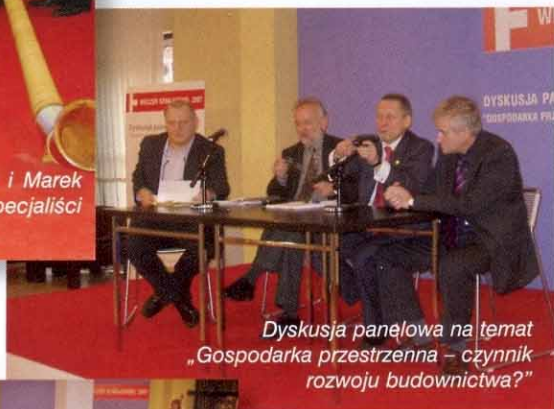
Dyskusja panelowa na temat „Gospodarka przestrzenna – czynnik rozwoju budownictwa?”