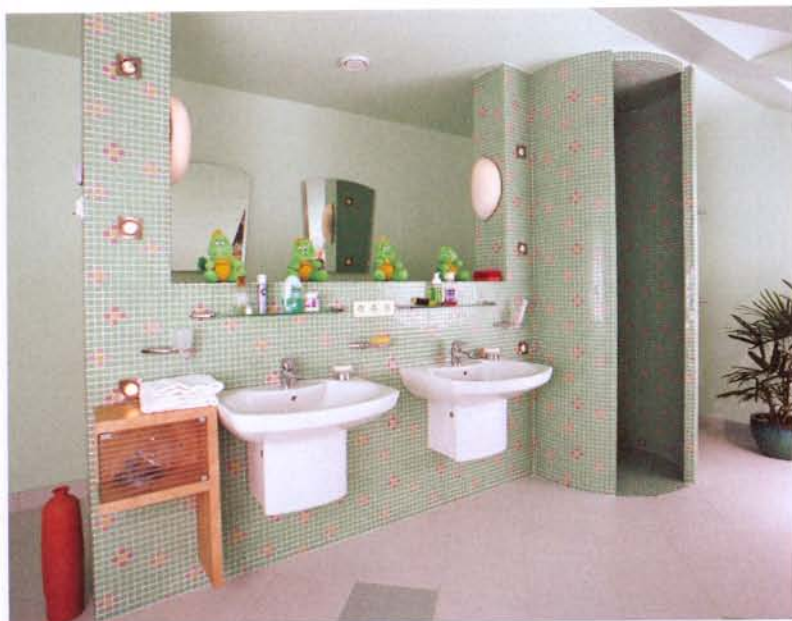
Montaż systemu instalacyjnego GIS

System instalacyjny GIS (Geberit Installation System) został stworzony głównie jako uzupełnienie rozwiązań standardowych.